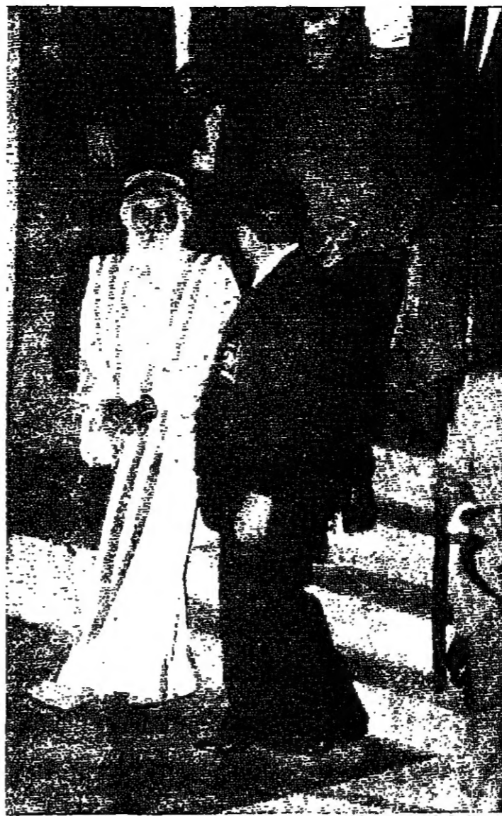
راجينش بين التباه وسجانه - كلمة اول والاخيرة... نظرة صامتة

لوس انجيلوس (ا.ب) من جيري واث - نوهي ليزا هارتمان التمثيل منذ ان كانت في الرابعة من عمرها. حيث كانت بعض الايام في النادي الليلي الذي كان يملكه والدها في تكساس. وعندما بلغت ليزا سن المراهقة كانت هواية التمثيل قد استبدت بها فاشتركت في تمثيل مسرحيتين في هيوستون في ولاية تكساس. وفي الوقت الحاضر تعتبر ليزا هارتمان احدى كواكب شركة ا.بي.سي. ام. التي تنتج العديد من المسلسلات والتلفزيونات. اضافة الى قسم الاخبار فيها الذي يغطي مجال اخبار العالم. وخلال عام ١٩٨٢ وقعت ليزا اتفاقية للاشتراك في سبع عشرة مسرحية مع نظامها مسرحية غنائية. وتقول ليزا: في اول عهدي بالتمثيل تصعبت شخصية مغنية الروك سيجي بوني. وقد ادت الدور برفق مما ساعدني في شهرتي كمغنية مسرحية ومغنية. وفي مطلع هذا العام التقت ليزا جوشوا روتش واشتركتا في مسرحية سولت بلسفيلد، والدور الذي اسند اليها في المسرحية هو زوجة روتش. وتقول: عندما تزوجت روتش. في المسرحية طبعاً. كنت اول امرأة في حياتي. وقد اقيمت معي في منزل والدي والذي بدت به. ثم انتقلت وايه الى شقة خاصة بنا الا ان حياتنا. واكثر في المسرحية فقط لم تستمر. وتقول ليزا حينها للتمثيل الى والدها المغني والممثل في ان واحد. هو الذي شجعني على امتحان التمثيل والغناء على المسرح. اما والدتي فكانت تعمل في احدى الشركات هيوستون. شهرين في جزر هاواي للراحة من عناء العمل. رغم ان العروض لا تزال تنهال عندما كنت في السابعة من عمري.